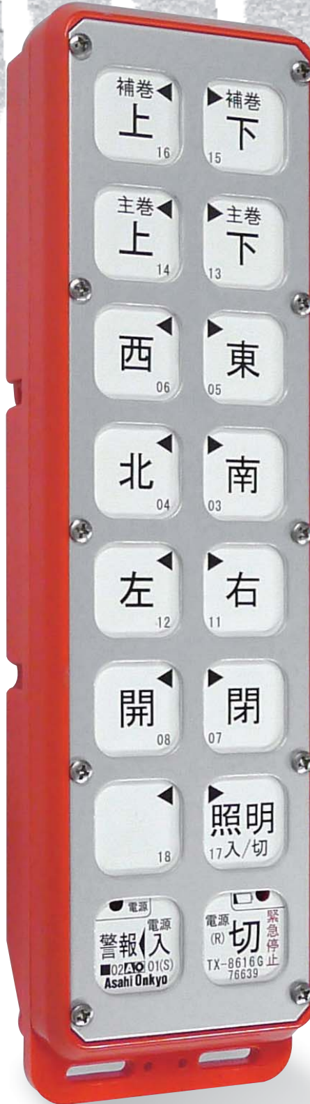
<16操作 標準型> TX-8616G型