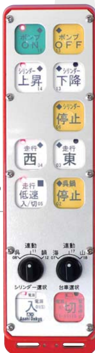
■ 送信機表面への 特殊スイッチ取付 ■ パネルプレートの 穴開け位置選択