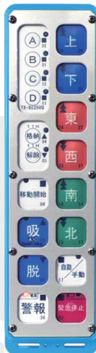
■ ハーフピッチ +カラー