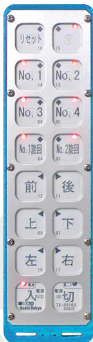
■ 選択LED (トグル)