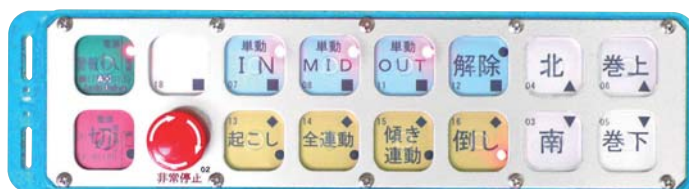
■ 送信機横向き ■ 表面への緊急停止スイッチ取付 ■ 選択LED(後押し保持+トグル保持) ■ カラーパネル