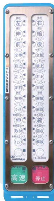
■ ハーフピッチ (多点数)